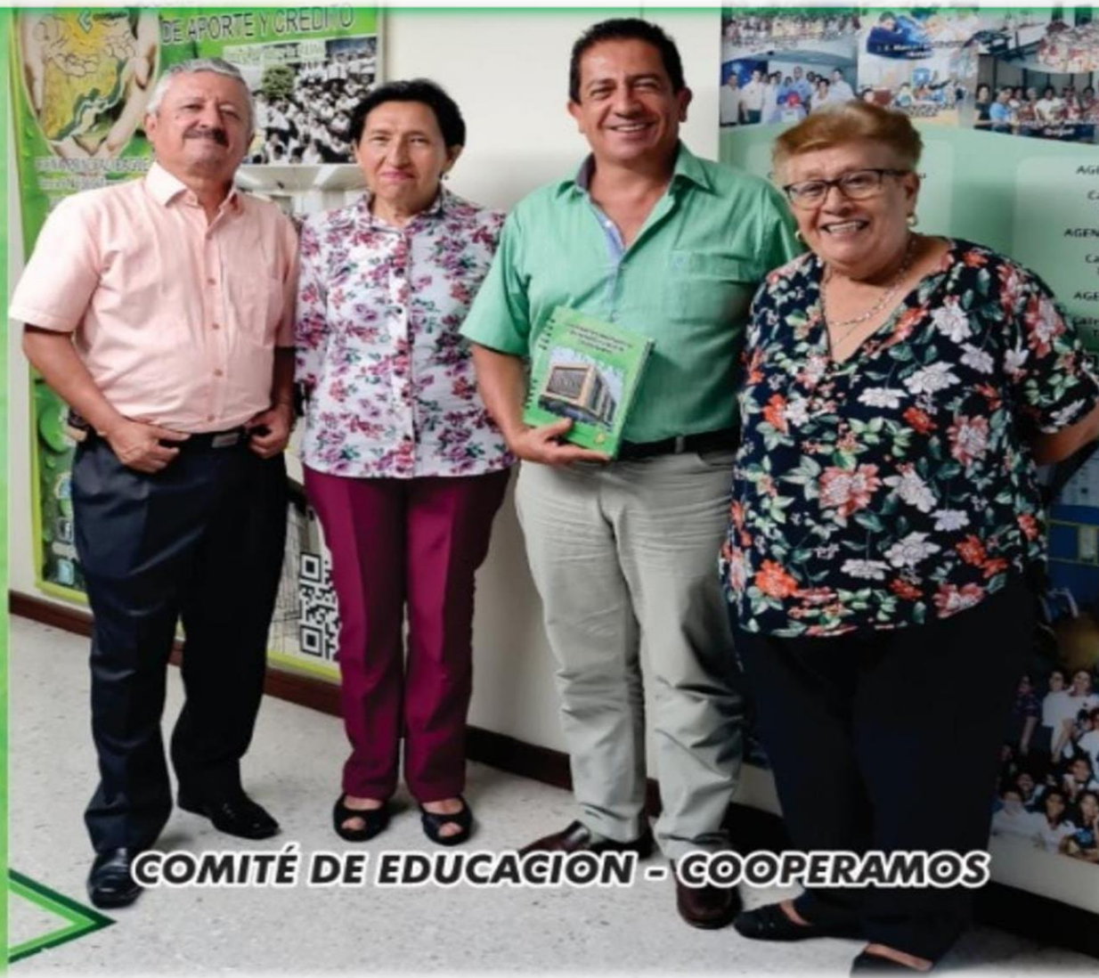
COMITÉ DE EDUCACION - COOPERAMOS